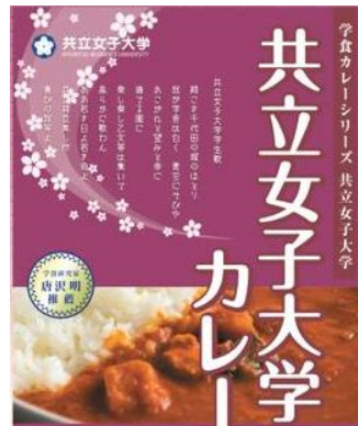
『共立女子大学』の公認学生 団体「食で世界を笑顔にする 会くすくす」のメンバーが 監修したレシピを元に商品化 ココナッツミルクトマトカレー