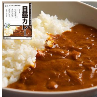
『日本大学芸術学部』 ガッツリと食べたい時に ピッタリなポークカレー