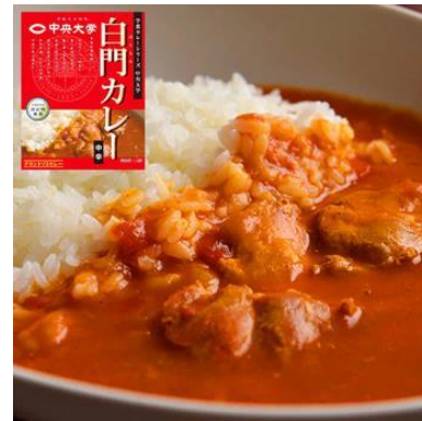
『中央大学』 トマトの風味を生かした ヘルシーなチキントマト味