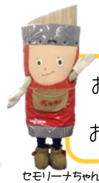
セモリーナちゃん