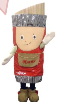
セモリーナちゃん

『ブカティーニ』と 検索すれば アマトリチャーナと ヒットするほど 相性は抜群だよ！