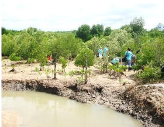
↑ マングローブの植樹場所