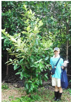
2010年に植樹したマングローブ こんなに大きくなりました! → (大倉:158cm)

↑ DIAキャンペーンでスタッフが着用しているTシャツです。今年は「笑顔で前へ一歩ずつ頑張れ 日本 東北」とプリントし、植樹やマラソン、その他イベントの活動を行っています